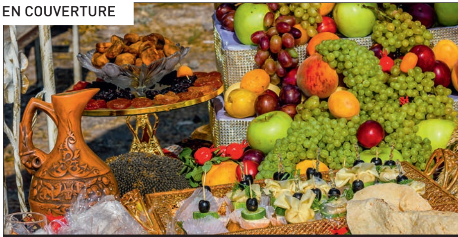
p. 5 / Notre dossier Spécial fêtes.