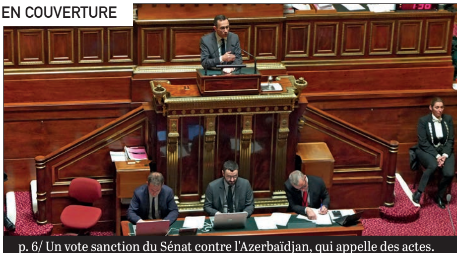
p. 6/ Un vote sanction du Sénat contre l'Azerbaïdjan, qui appelle des actes.