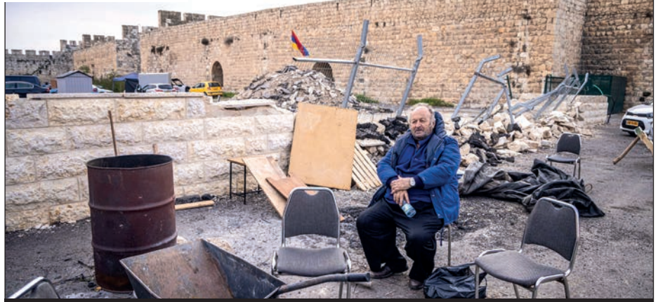
p. 5/ La bataille de Jérusalem a commencé.